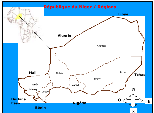
TENDANCE DU NIVEAU DE LA PREVALENCE LE31/12 ET DE LA DETECTION ANNUELLE DE LA LEPRE DE 1993 A L'AN 2004 AU NIGER