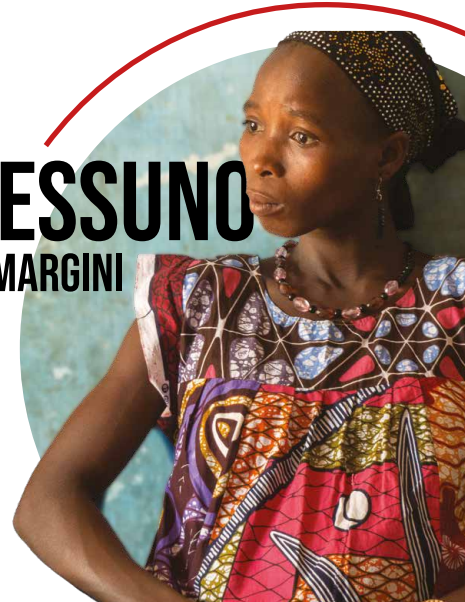
Guinea Bissau AIFO