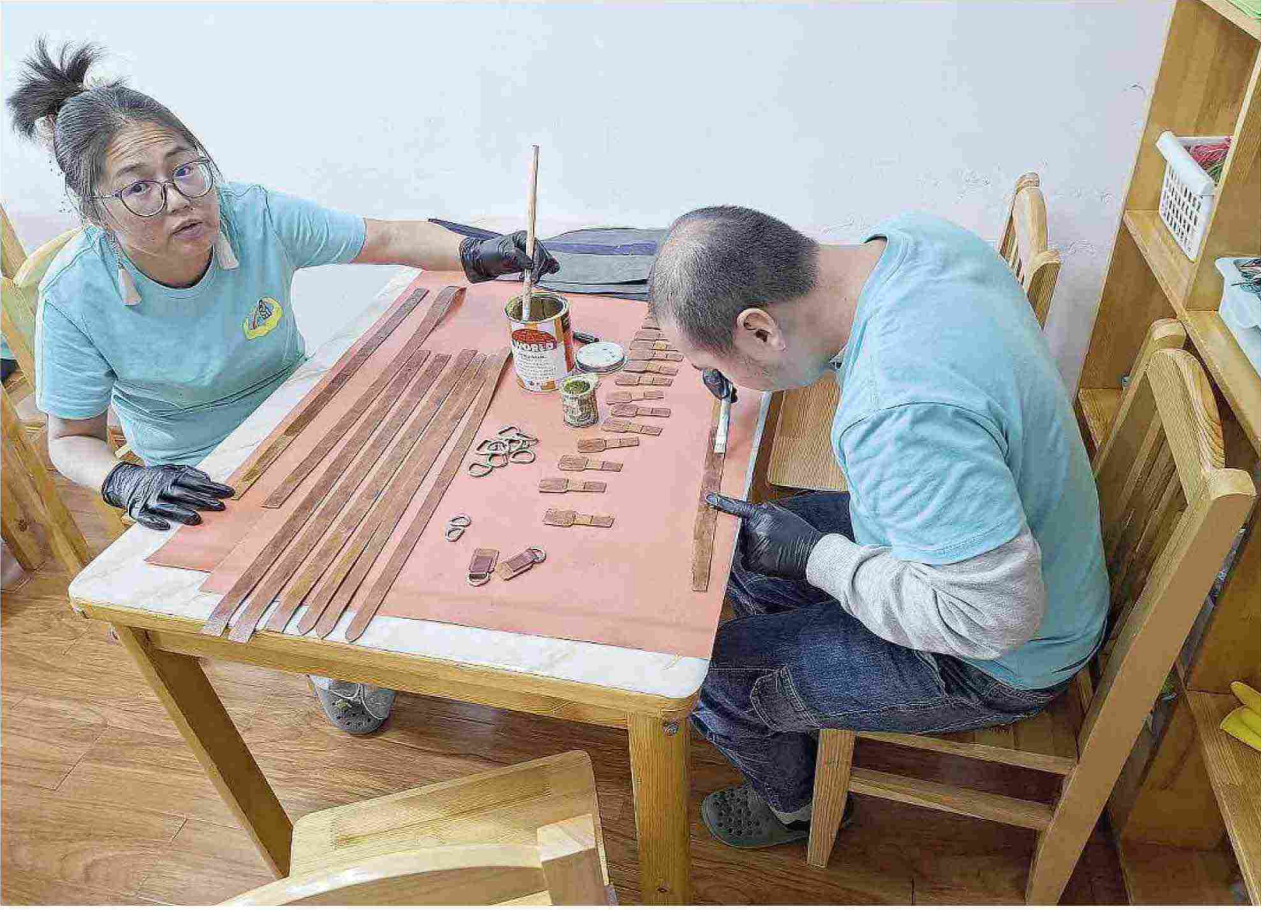
Disabili impegnati nell'artigianato. Sopra, Saranchulun Otgong, prima parlamentare disabile nella storia del Parlamento mongolo

Ritaglio stampa ad uso esclusivo del destinatario, non riproducibile.